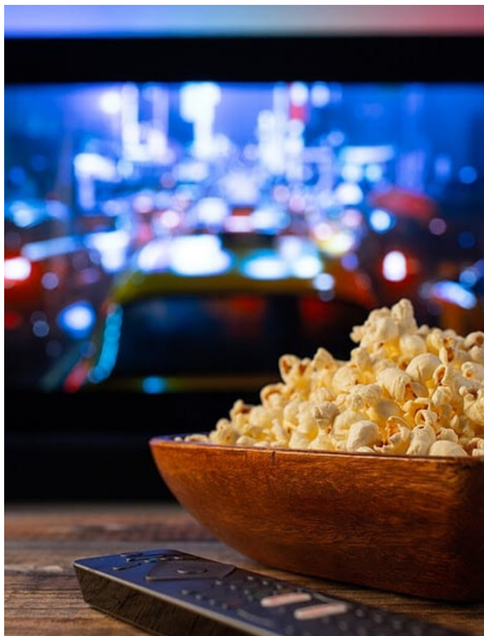
TRANSCENDÊNCIA DA MEIA IDADE. (ILUSTRAÇÃO: JAN BUCHCZIK)