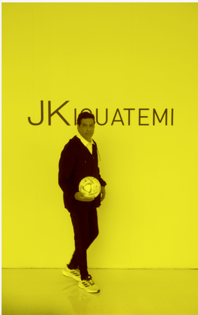
GENTLEMEN'S DAY NO JK.