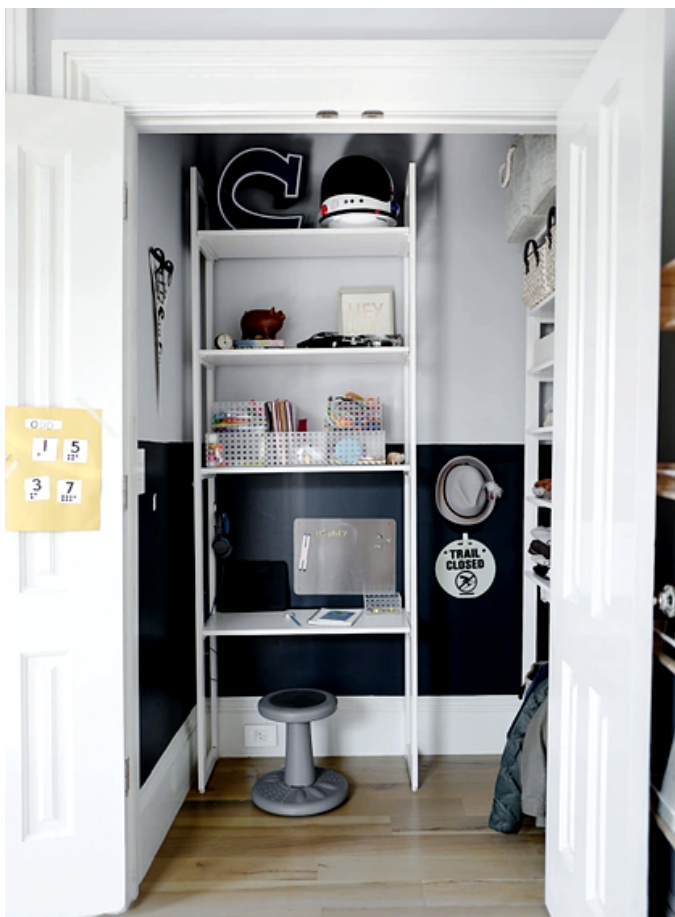
CLOFFICE: ESCRITÓRIO E CLOSET.

As soluções para home office que no início da pandemia soavam temporárias, agora são permanentes. Vemos transformação de espaços multifuncionais, como os “shoffices”, nos galpões, e os “cloffices”, nos armários, projetados para diferentes demandas, como desde videochamadas do trabalho ao armazenamento de itens da casa. Reimaginar o local do home office também impulsionou a inovação no setor de design personalizado, incluindo o lançamento de plataformas virtuais e o treinamento de designers para fazer medições precisas via webcam e encontrar maneiras de personalizar mesas, tomadas, iluminação, armários e gavetas ocultos, entre outros. Outra tendência observada é a busca por uma paleta de cores mais quente e aconchegante, que torna o ambiente de trabalho mais convidativo.