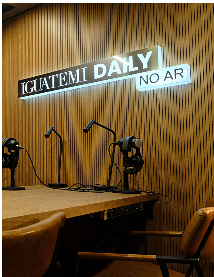
ESTÚDIO IGUATEMI DAILY.