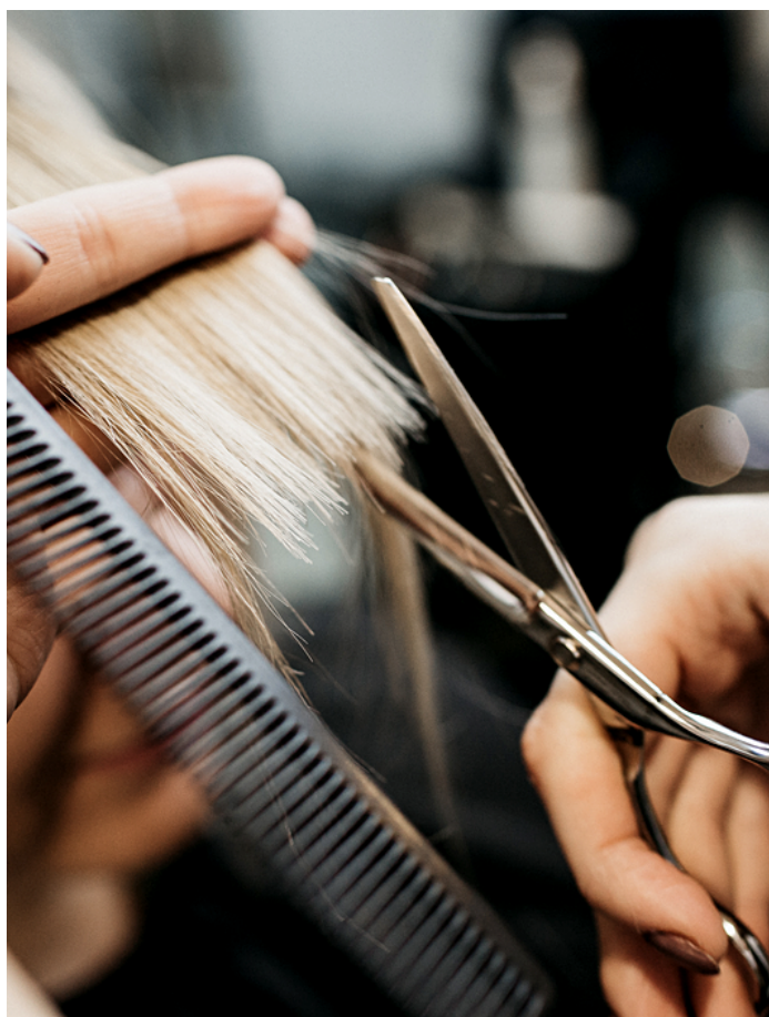
CORTE DE CABELO.

Ao passar horas no salão de beleza se encarando no espelho com cabelos desalinhados, papéis de alumínio e toucas, a chance de observar minuciosamente imperfeições aumenta. Independente do quão incrível seja o resultado final, o processo pode desencadear sentimentos autodepreciativas. Para eliminar esse julgamento, o Not Another Salon , em Londres, criou o “ Mirrorless Haircut ”, em que os profissionais só utilizam o espelho no início, para discutir detalhes sobre corte e cor, e depois o cobrem ou viram a cadeira. Embora não seja uma transformação às cegas, visto que os clientes podem consultar o progresso durante todo o processo se assim o desejarem, a experiência reforça a confiança e autoestima.