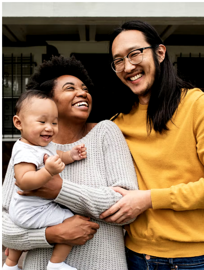
PARENTALIDADE PLURILÍNGUE.

As sociedades cada vez mais diversas, com pessoas se movendo e trazendo consigo suas línguas e culturas, estão impulsionando o que os linguistas chamam de parentalidade plurilíngue . Divisões e restrições por vezes são feitas para que a criança não se confunda; contudo, adotar uma abordagem plurilíngue, utilizando o idioma de maneira fluída e dinâmica, além de ser mais flexível para as famílias e mais inclusiva para as crianças, é algo defendido por muitos especialistas. Um princípio importante nesse conceito é a interconexão entre língua materna e cultura, em que o idioma é crucial para a identidade, pertencimento e entendimento da ancestralidade. Com fluidez, não há mal nenhum em manter a língua e a cultura de herança no dia a dia.