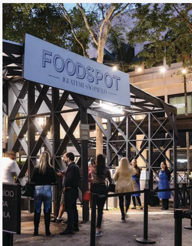
FOODSPOT, FESTIVAL GASTRONÔMICO.

O festival gastronômico ao ar livre do Iguatemi, FOODSPOT, está de volta em sua 8ª edição, de 27 a 28 de agosto, das 12h às 21h, no Boulevard do Iguatemi SP. O festival oferece as melhores opções da cozinha paulistana e faz parte do calendário de gastronomia da cidade, com chefs de diferentes vertentes e cardápios exclusivos, de pratos salgados a sobremesas. E para completar o menu, o FOODSPOT traz atrações musicais ao vivo e oficinas infantis também prometem entreter os visitantes, durante esses dois dias de evento.