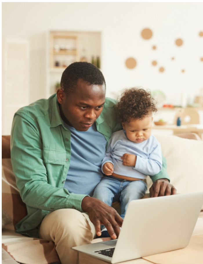
LICENÇA-PATERNIDADE E HOME OFFICE PARA PAIS.

Com os crescentes debates sobre a conciliação da maternidade com o trabalho, é preciso permitir que os pais também sejam completos. A Forbes publicou três passos para colocar a paternidade na agenda da liderança, impulsionar a equidade de gênero e normalizar (e incentivar) pais participativos. Um deles é compartilhar a própria realidade e ampliar a perspectiva de que não são apenas as mulheres que fazem malabarismos com vários papéis. Outro ponto é reconhecer a paternidade como uma prioridade do século XXI, estimulando jovens pais a tirarem licença parental. Por fim, o último passo é construir segurança psicológica com as equipes, visto que muitos pais deixam de se ausentar do trabalho por receio de impactar a carreira, mas, no final das contas, a paternidade é um trabalho de período integral, 365 dias do ano.