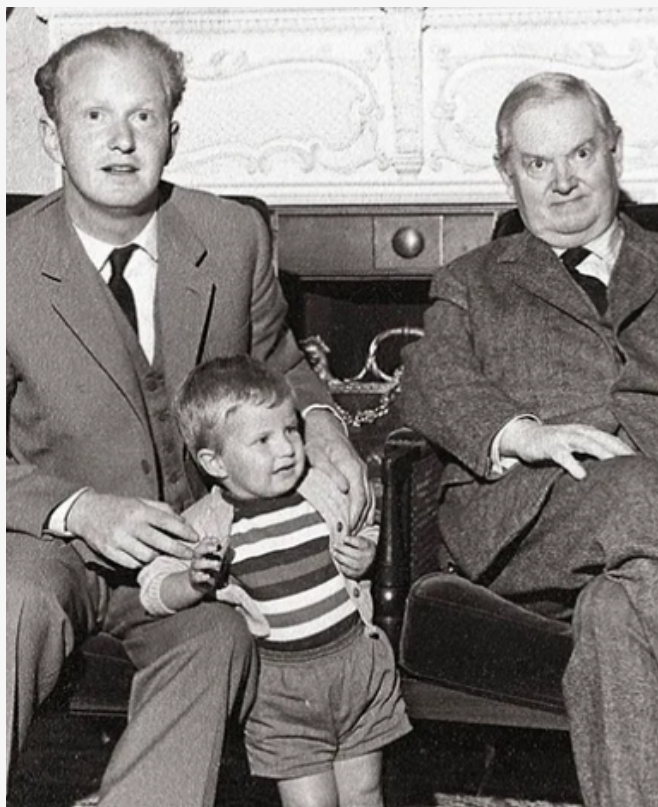
AUBERON, ALEXANDER E EVELYN WAUGH.