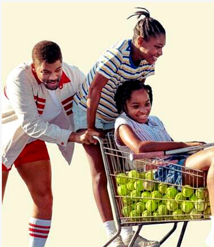
KING RICHARD

REMAKE DO FILME DE 1950 E INSPIRAÇÃO PARA A VERSÃO DE 2022, O CLÁSSICO DE 1991 ABORDA A HISTÓRIA DE UM PAI SUPERPROTECTOR QUE NÃO ESTÁ PREPARADO PARA VER A FILHA SE CASAR E PROVOCA CONFUSÕES DO NOIVADO ATÉ O CASÓRIO.