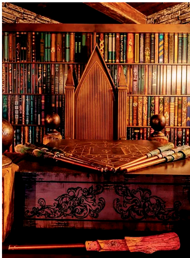
PANIQ ESCAPE ROOM DE CHICAGO.

De fliperamas a videogames, jogos atravessam gerações e, agora, começaram a moldar viagens em família, de suítes decoradas a passeios de aventura. A revista Travel + Leisure reuniu hotéis e iniciativas ao redor do mundo, alguns já consolidadas e outros em construção, para aproveitar o universo gamer e se divertir. Entre as seleções, estão o Super Nintendo World, em Osaka, e sua experiência imersiva; o Star Wars: Galactic Starcruiser, em Orlando, que promove duas noites a bordo do hotel da nave espacial Halcyon da Disney; os hotéis Atari, com fliperamas de estilo retrô e entretenimento imersivo; o GACUGON, um cruzeiro com salão de jogos, mangás e treinamento de combate RPG em ação ao vivo; e o Departure Lounge, no Texas, que personaliza viagens com base no videogame de escolha do viajante.