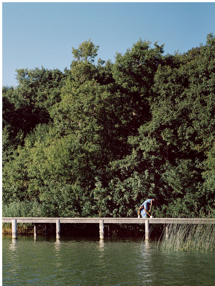
AUTOUIDADO OU EGOCENTRISMO?

Onde está o limite entre o autocuidado e o egocentrismo? Pensando nessa linha tênue, essa matéria da Vogue Escandinávia lembra que, para além dos benefícios pessoais, o propósito do chamado “self-care” está também em cuidar do outro. Ações como a prática de yoga, meditação e outras formas de autocuidado estão sendo apropriadas pela crescente indústria de wellness – estimada pela McKinsey em mais de US$ 1,5 trilhões –, em uma narrativa focada no ocidente e que não reconhece sua participação em práticas neocoloniais, utilizando do cuidado e da cura como ferramenta de marketing e consumismo. A alternativa, segundo a publicação, está no “autocuidado radical”: cuidar de si mesmo é também dar de volta para a comunidade.